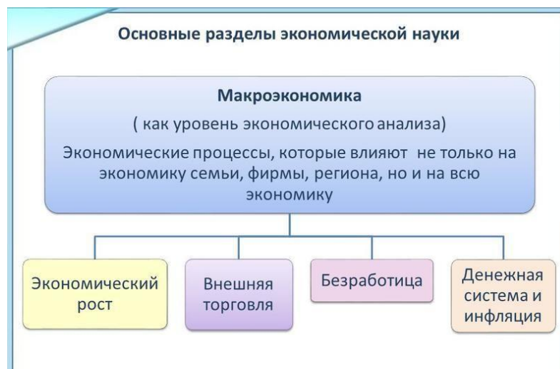
Рис. 2. Макроэкономические процессы.

Кроме того, анализ социально-экономических процессов имеет и хронологический критерий, то есть анализировать их можно и во времени, и в пространстве. Например, если рассматривать социально-экономические процессы в России XVII в., то можно отметить следующее.