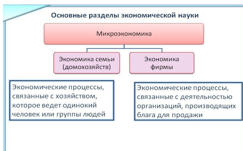
Рис. 1. Микроэкономические процессы.

Например, если микроэкономике представляют экономика семьи (домохозяйства) и экономика фирмы, то, следовательно, им соответствуют экономические процессы, связанные с хозяйством, которое ведет одинокий человек или группа людей (домохозяйство). Экономические процессы, связанные с деятельностью организаций, производящих различные блага (товары и услуги) для продажи, соответствуют экономике организации (предприятия, фирмы) (см. рис. 1).